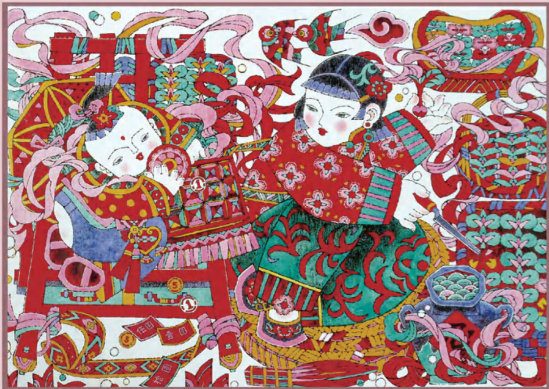
春集（年画·局部） 现代 丁希明