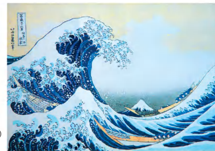
神奈川冲浪里（浮世绘） 1831 葛饰北斋（日本）

看，画家笔下的黄河波涛汹涌，船夫奋力地与激流抗争。同时倾听钢琴协奏曲《黄河》，试用几句话来表达你的感受。