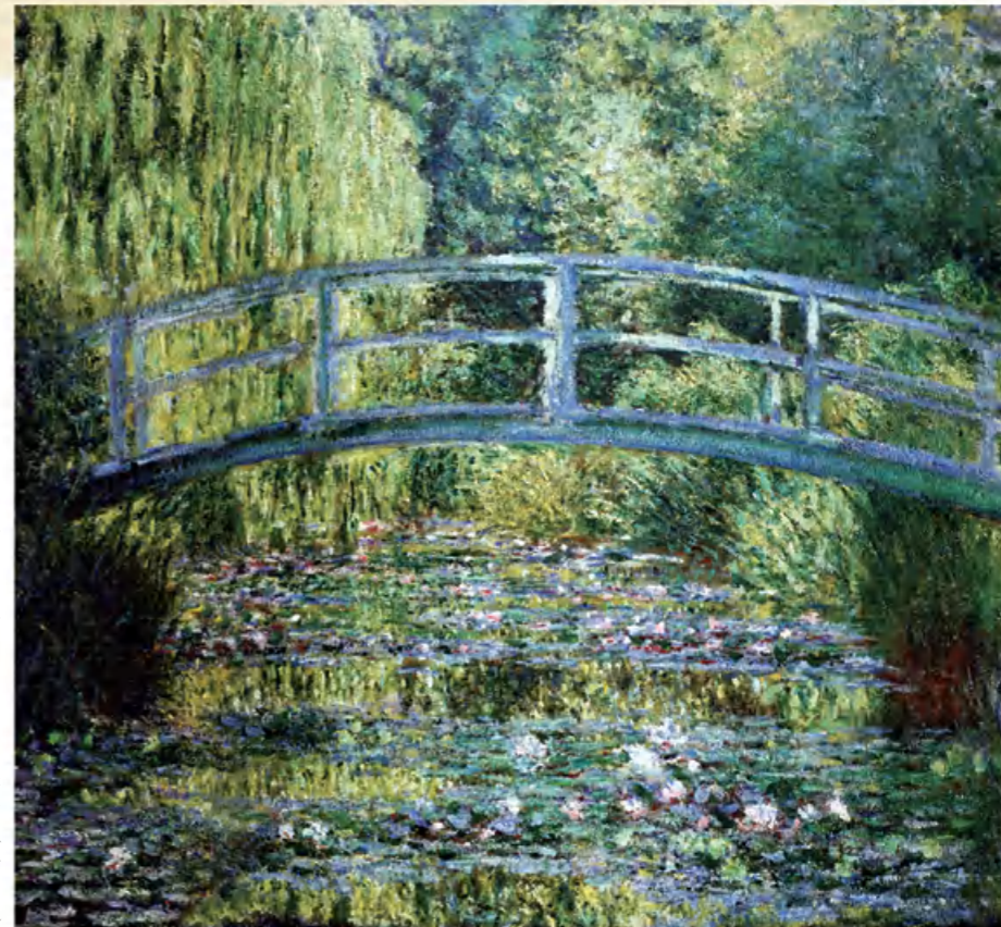
绿色的种着睡莲的池塘（油画） 1899 莫奈（法国）