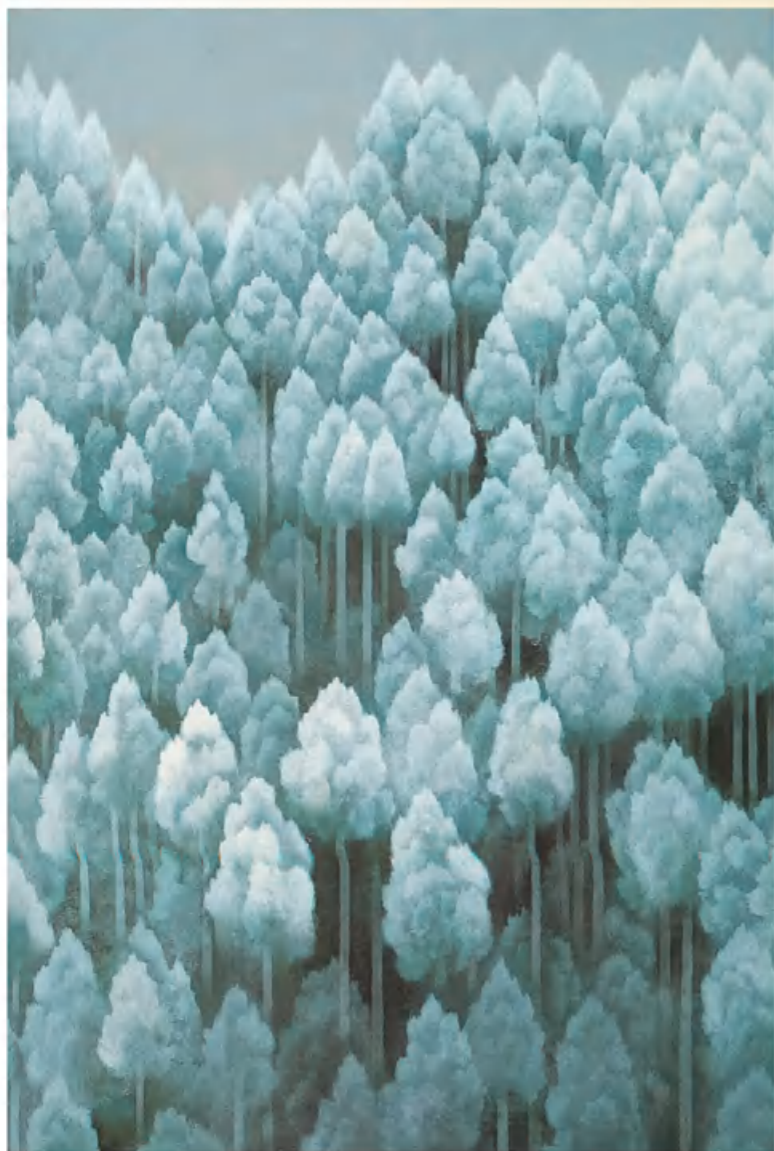
北山初雪（日本画） 1965 东山魁夷（日本）