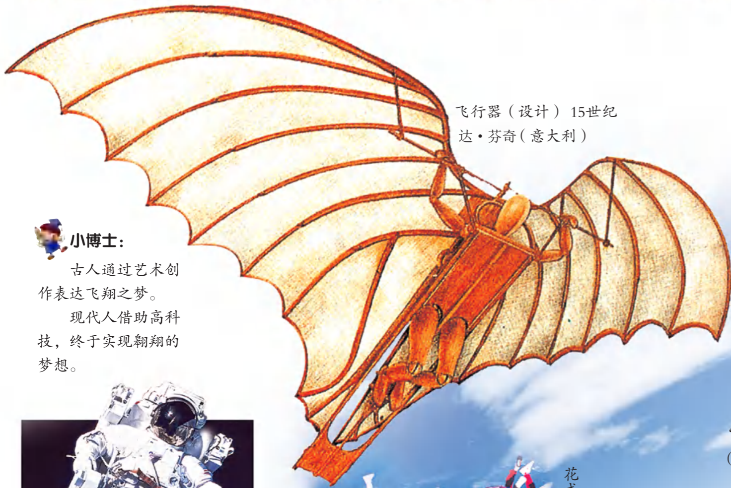
飞行器（设计）15世纪 达·芬奇（意大利）