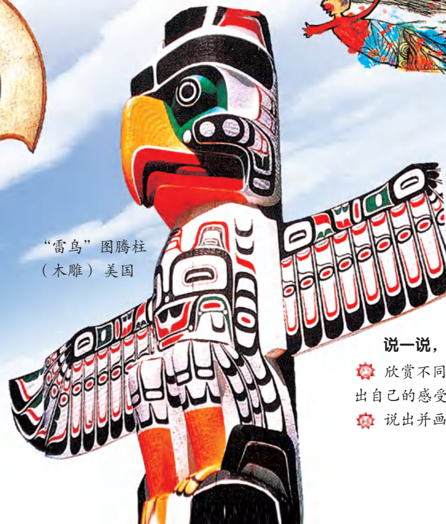
“雷鸟”图腾柱 （木雕）美国