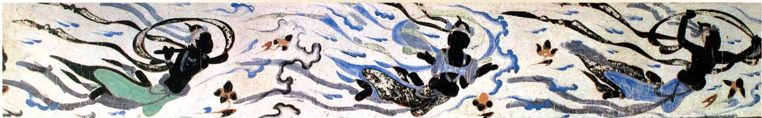
伎乐飞天（敦煌壁画）隋代