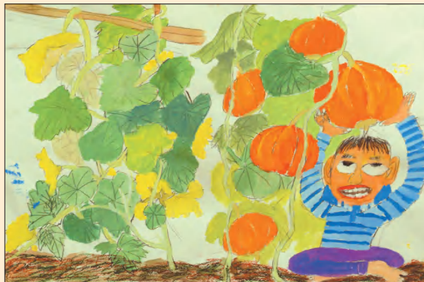
我种的南瓜 学生作品（铅笔、水粉）