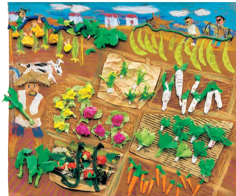
菜地 学生作品（色纸、彩色粉笔、废旧材料）