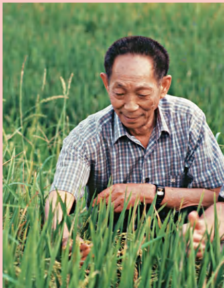
袁隆平爷爷被誉为“杂交水稻之父”