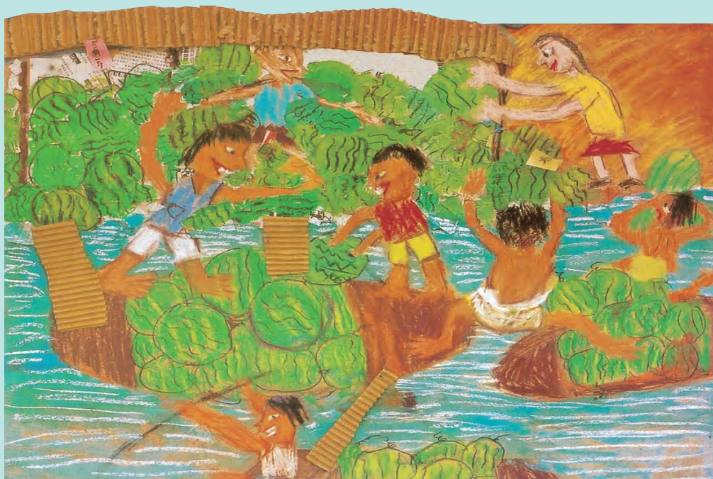
运瓜 学生作品（彩色铅笔、水粉、废纸）