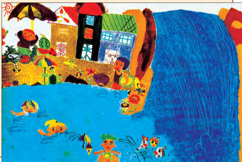
游泳 学生作品（铅笔、水粉）