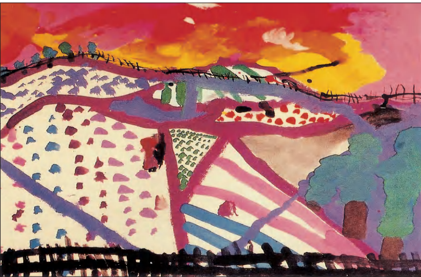
彩霞 学生作品（水粉）